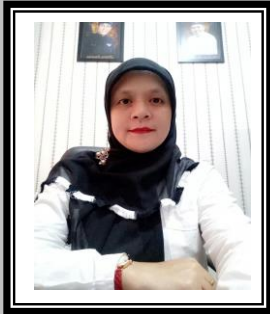
AI SAIDAH, SE.,MM

KEPALA BIDANG PENGEMBANGAN SUMBER DAYA MANUSIA BKPSDM